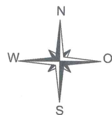
СХЕМА ПЛАНИРОВОЧНОЙ ОРГАНИЗАЦИИ ЗЕМЕЛЬНОГО УЧАСТКА М 1:500